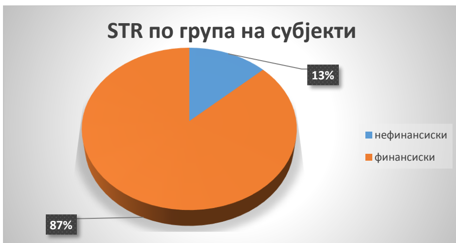
График број 1 -

Шематски приказ на примени STR по група на субјекти во текот на 2023 година