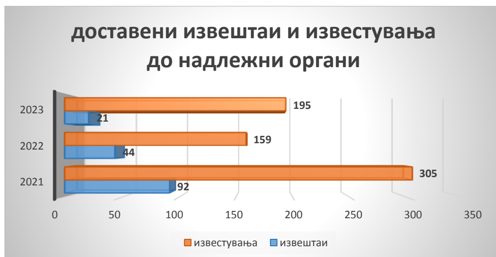
График број 4 - Шематски приказ за доставени Извештаи и Известувања споредбено 2021, 2022 и 2023 година

На следниот приказ направена е споредба на бројот на извештаи и известувања кои Управата ги доставила до надлежните органи на нивно понатамошно постапување во текот на 2021, 2022 и 2023 година.