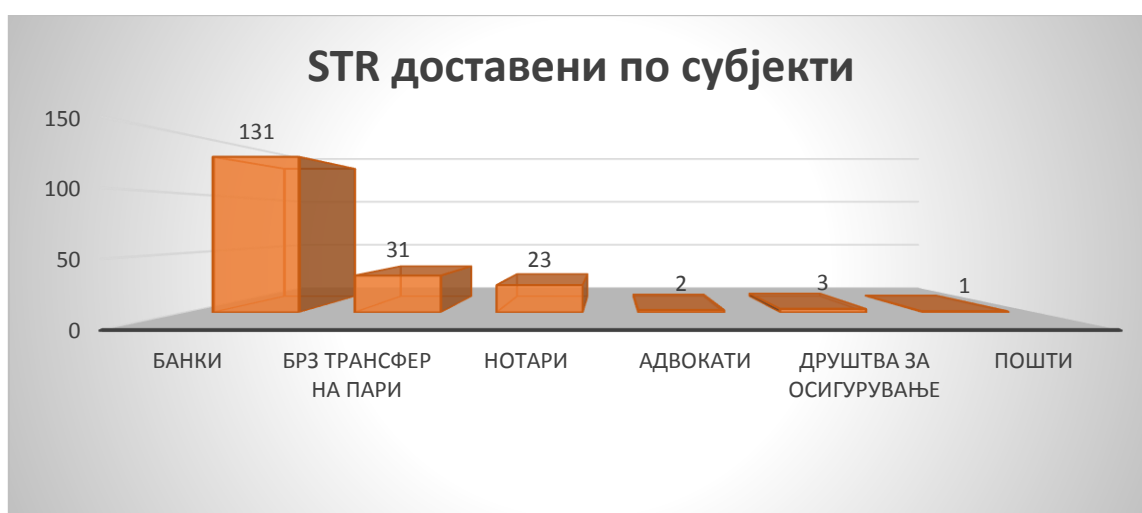
График број 2- Шематски приказ на примени STR по видови на субјекти во текот на 2023 година

Шематски приказ на примени STR по група на субјекти во текот на 2023 година