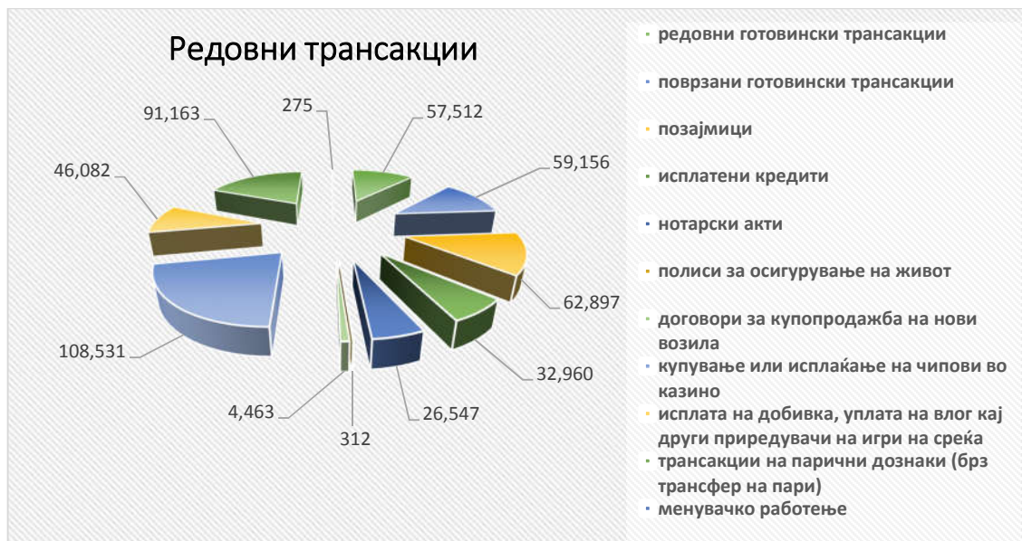
График број 3 - Шематски приказ на редовни трансакции во 2022 година

На шематскиот приказ е прикажан вкупниот број на извештаи кои во текот на 2022 година по редовна основа се доставени од страна на субјектите до Управата.