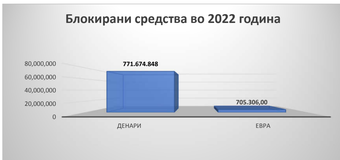
График број 5 - Шематски приказ на примена на привремени мерки во текот на 2022 година