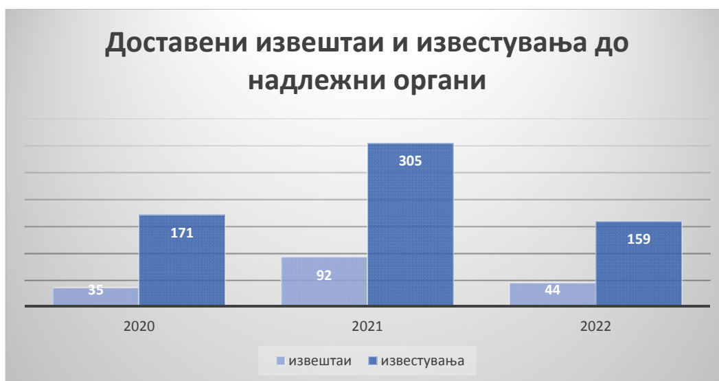
График број 4 - Шематски приказ за доставени Извештаи за перење пари и финансирање на тероризам споредбено 2020, 2021 и 2022 година

На следниот приказ направена е споредба на бројот на извештаи и известувања кои Управата ги доставила до надлежните органи на нивно понатамошно постапување во текот на 2020, 2021 и 2022 година.