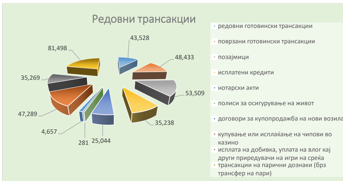
График број 3 - Шематски приказ на редовни трансакции во 2021 година