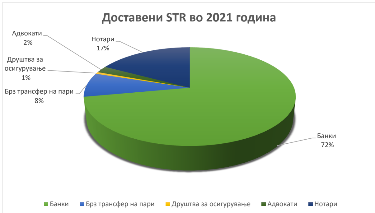
График број 2