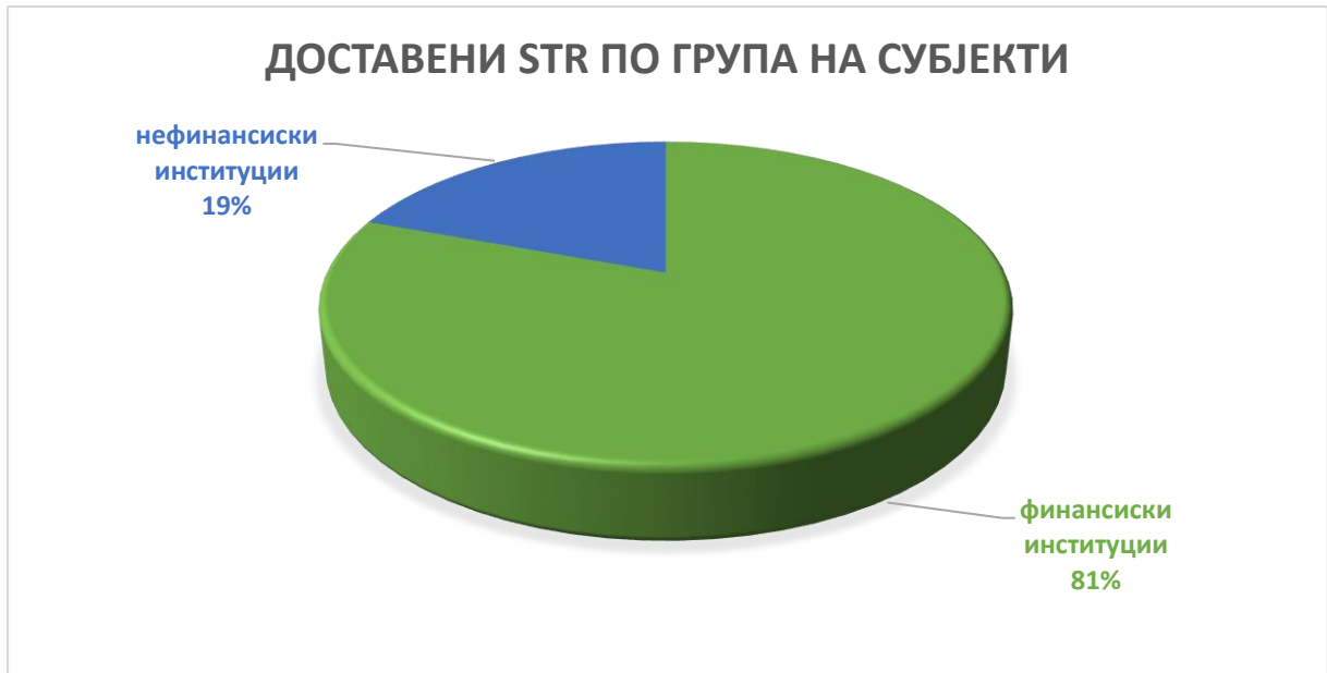
График број 1 - Шематски приказ на примените STR по група на субјекти во текот на 2021 година