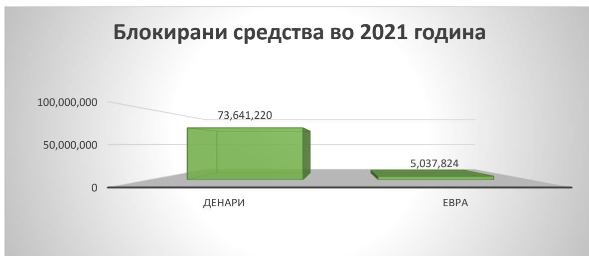
График број 5 - Шематски приказ на примена на привремени мерки во текот на 2021 година

Согласно член 120 од Законот, при постоење на сомневање за сторено кривично дело перење пари и/или финансирање на тероризам Управата може да достави до надлежниот јавен обвинител барање за поднесување предлог за определување на привремени мерки. Во текот на 2021 година, Управата до надлежен јавен обвинител поднесе барања за поднесување предлог за определување на привремени мерки за 6 случаи, при што од страна на судот беа донесени решенија за примена на привремена мерка за привремено задржување на вкупно 73.641.220,00 денари и 1.676.315,69 ЕУР. Дополнително, во рамките на меѓународната соработка за еден случај Управата достави барање за поднесување предлог за определување на привремени мерки до Единица за финансиско разузнавање на друга држава, при што од страна на надлежен суд беше изречена мерка за привремено задржување на вкупно 3.361.509,94 евра.