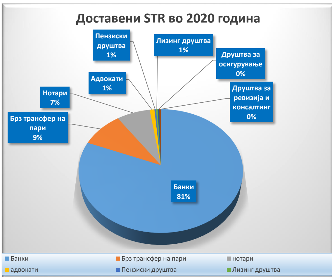
График број 2