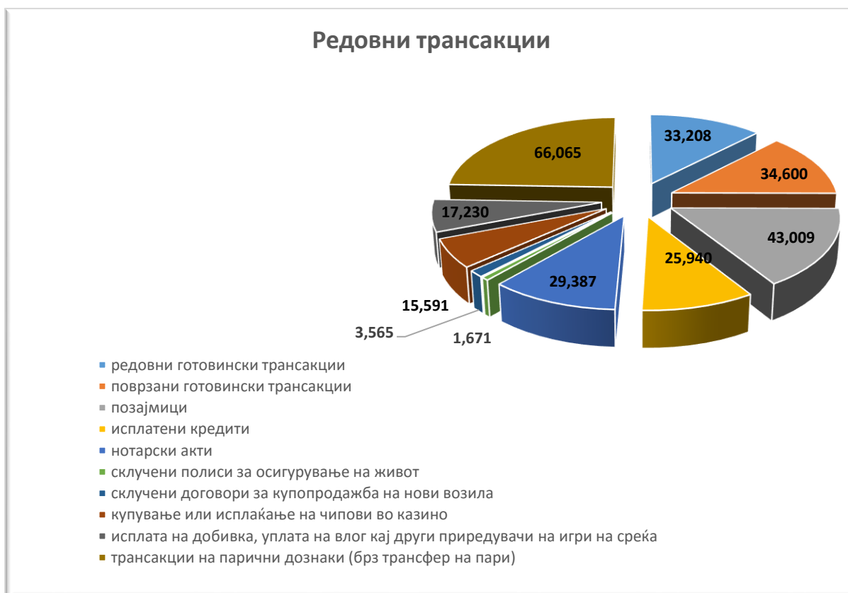
График број 3 - Шематски приказ на редовни трансакции во 2020 година