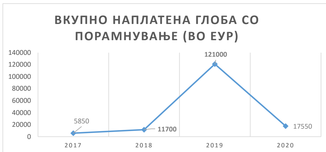
График број 6 - Шематски приказ на наплатени глоби со порамнување по години: