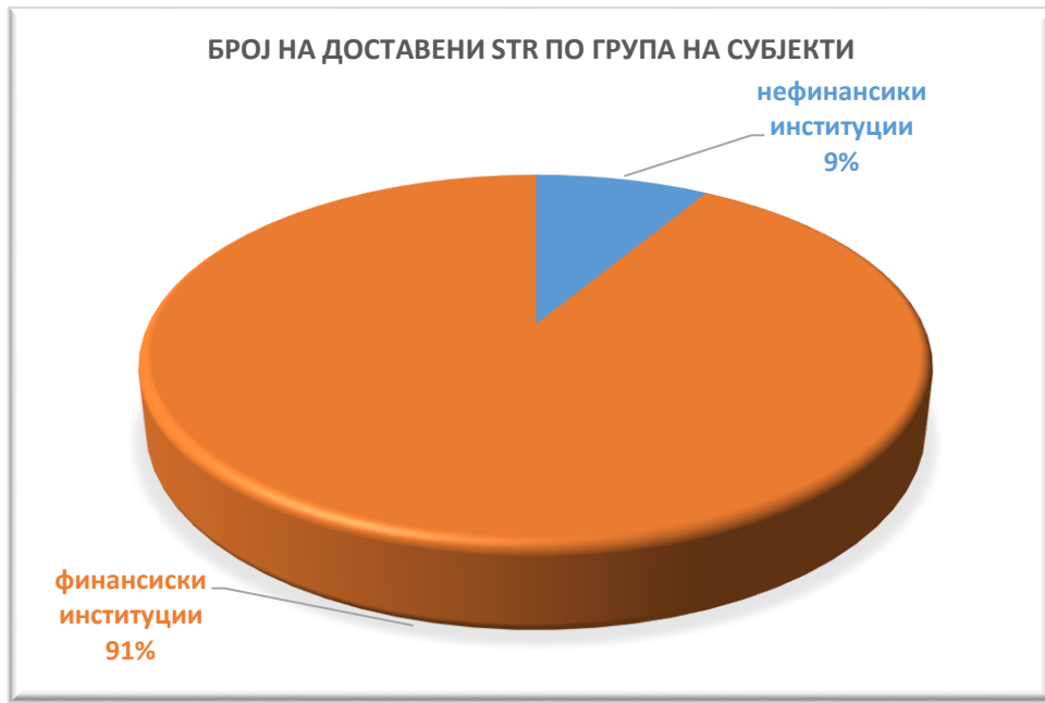
График број 1 - Шематски приказ на примените STR по група на субјекти во текот на 2020 година